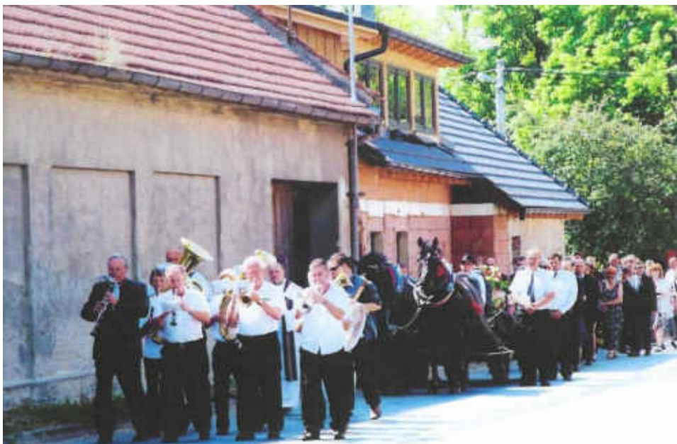
Smuteční průvod jde z kostela na místní hřbitov – rok 2015

A tak nakonec je třeba o svátku zesnulých zajít na hřbitov, a tam uctít památku svých blízkých, které už na jejich životní pouti smrt kmotřička dostihla. Rozsvítit svíčku a zavzpomínat, protože jednou budeme na jejich místě i my.