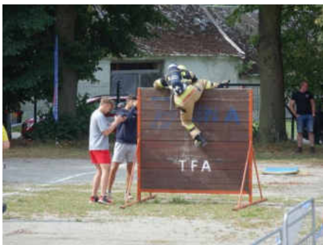
Závodník zdolává poslední a také jednu z nejtěžších překážek závodu – bariéru