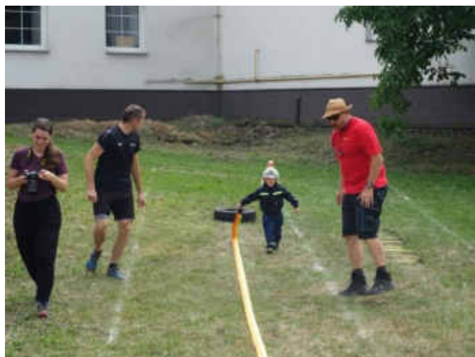
Současně se závodem TFA dospěláků probíhala také soutěž TFA pro děti