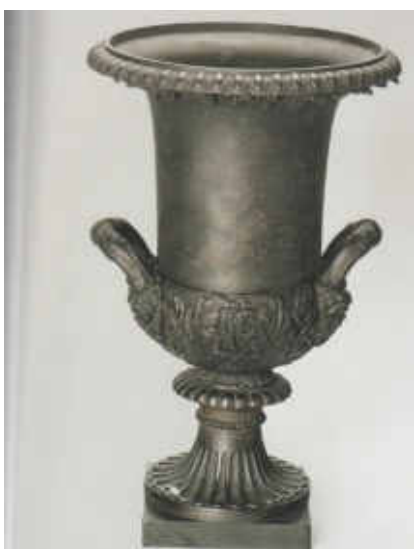
Na snímku Kráterová váza – dílo G.J.Schirmera z r.1821