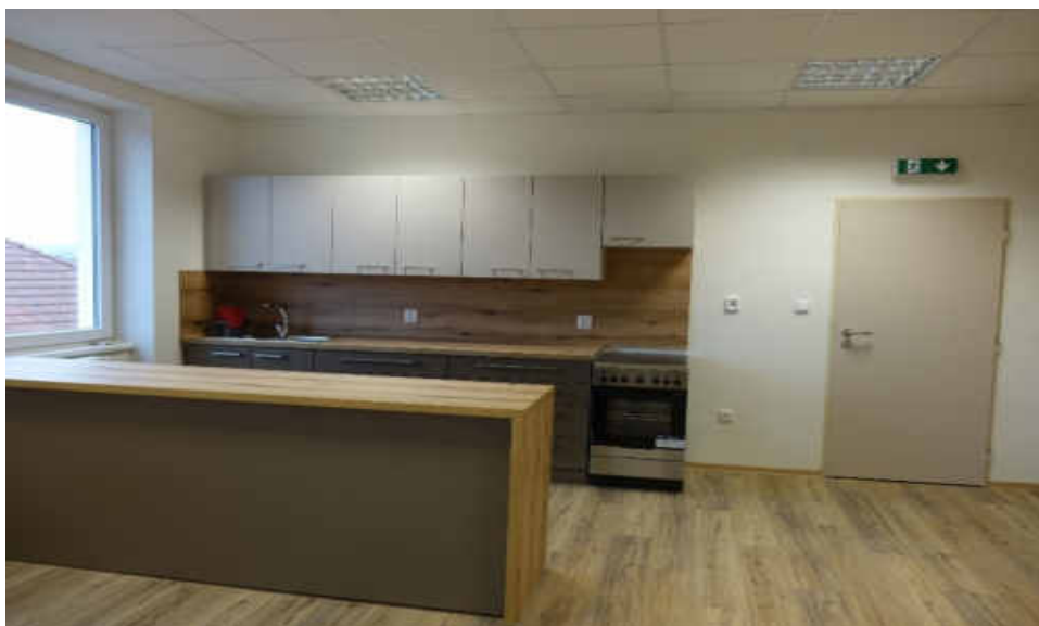
Jídelna s novou kuchyňskou linkou