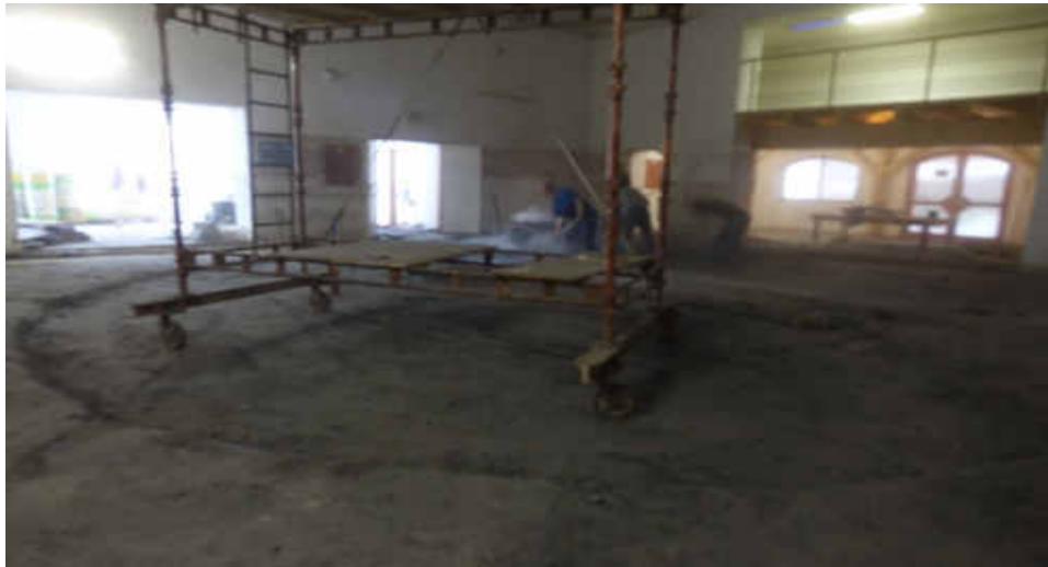
Při bourání byl objeven prostor, kde mělo být otáčecí jeviště