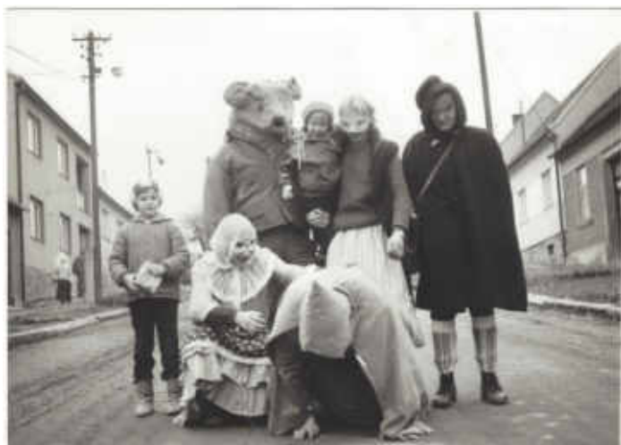
Pochůzka masek (část průvodu) rok 1987 nebo 1988 – ul. 28. října