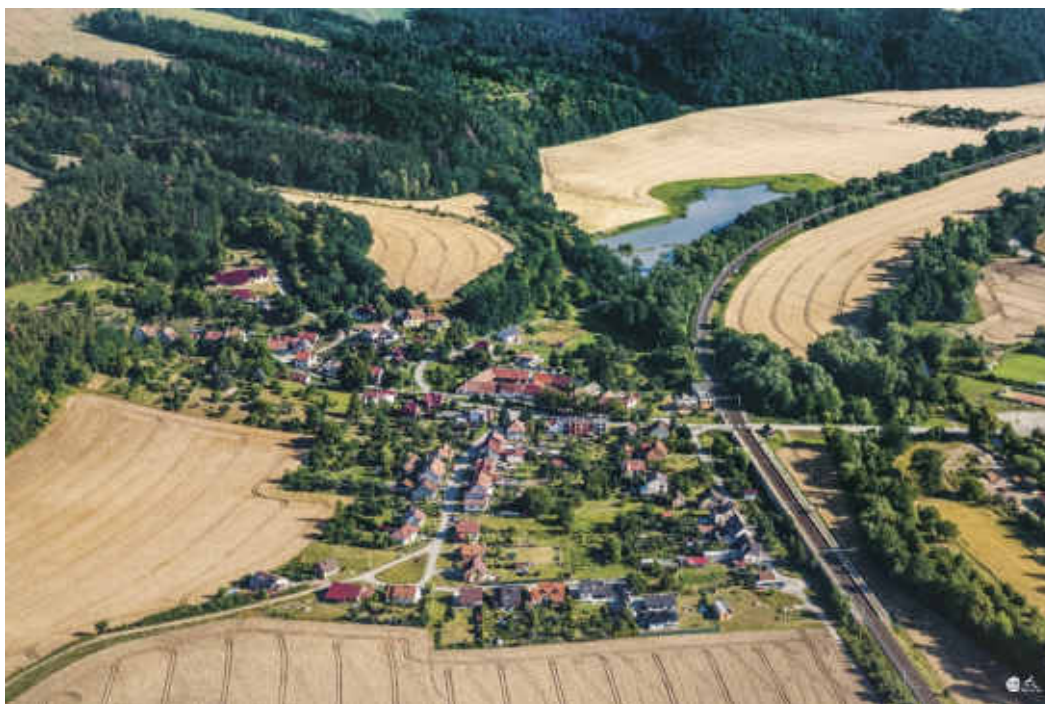
Na fotografii pohled na Klemov - rok 2019