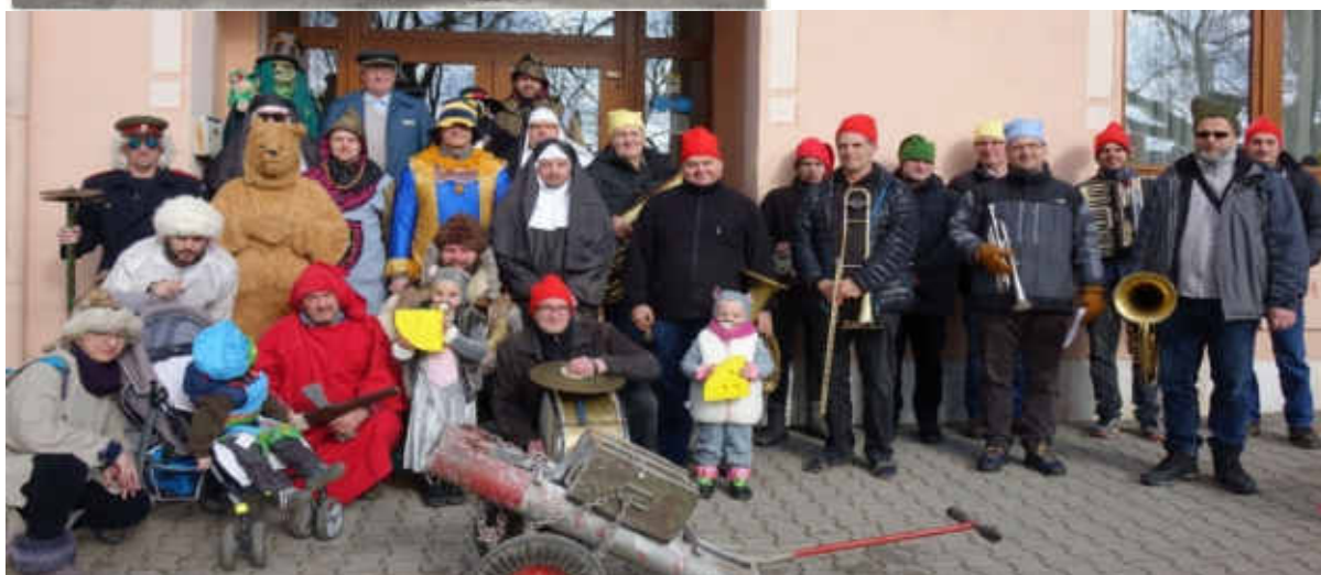
Pochůzka masek v roce 2020 – doprovod Královská hudba z Habrůvky