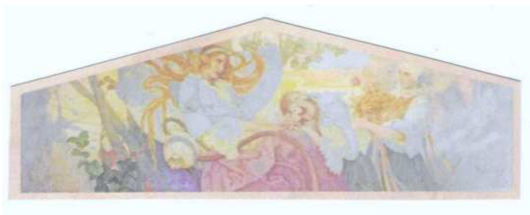
Fotografie obrazu „Bud' pozdravený, požehnaný pramen zdraví“